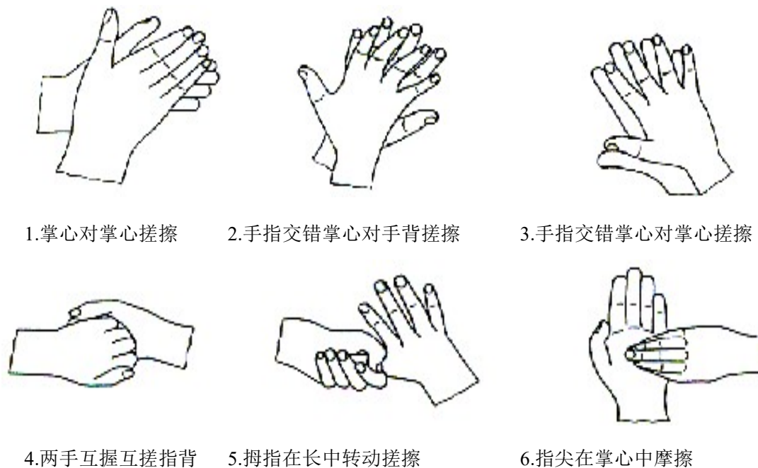
图 2-1 标准的洗手方法

(9) 参考样品组：对于卫生手消毒，取 60% 异丙醇 3 ml 到入手心中，按标准的洗手方法用力搓擦 30s。以确保手的所有部位均匀接触异丙醇。重复使用异丙醇按上述方法搓擦使总的搓擦时间为 60s。对于外科手消毒，使用 60% 正丙醇 3ml，按标准的洗手方法用力搓擦，当接近干燥时，再加 3ml 正丙醇搓擦。以保持作用 3min。用流动的自来水冲洗 5s，抖掉手上残留的水。其余步骤与试验样品组相同。